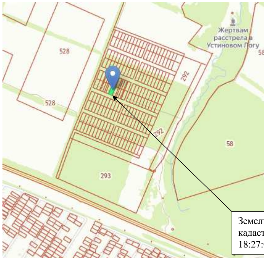
Рис.1. Схема расположения земельного участка в кадастровом квартале

Земельный участок с кадастровым номером 18:27:070002:520